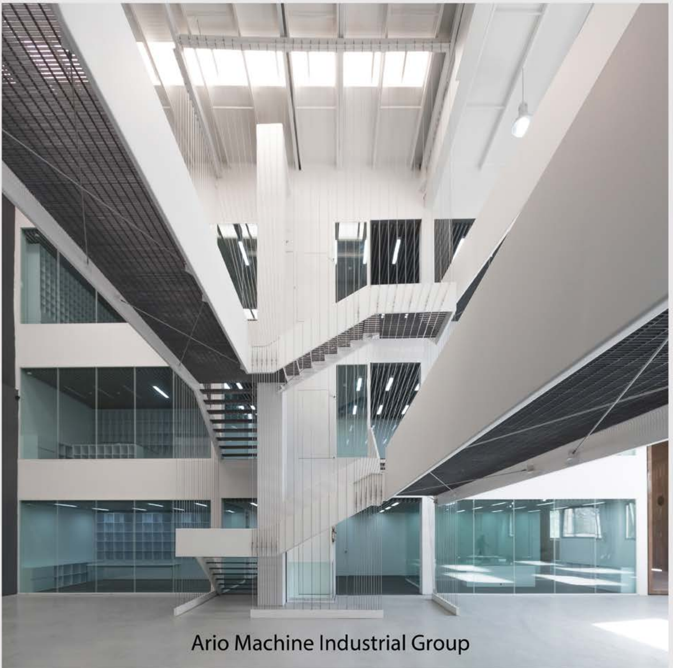
Ario Machine Industrial Group

همواره تلاش بر ارائه خدمات اعتباری به مشتریان جهت سهولت در تهیه ماشین آلات و حفظ و ارتقاء جایگاه شرکت در عرصه داخلی و بین المللی نیز داشته ایم .